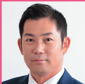
特別ゲスト 岩田 稔 氏 (元阪神タイガース投手)