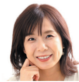
アシスタント 河島 あみる (タレント・ミュージシャン)

(経歴)大阪桐蔭高校～関西大学～阪神タイガース(2006年～2021年)、通算成績:200試合 60勝82敗 防御率3.38 高校2年生秋からエースとして活躍するもウイルス感染が原因で1型糖尿病を発症。2005年の大学・社会人ドラフト会議で阪神タイガース入団。入団1年目から1軍デビューを果たし、3年目の2008年にローテーション入りし、プロ初勝利とシーズン10勝を挙げる。2009年第2回WBC日本代表に選出、2大会連続2度目の優勝に貢献。日本シリーズでの先発や貴重な中継ぎ左腕として活躍後、2021年阪神タイガース一筋16年の現役生活を引退。2022年阪神タイガースの「Community Ambassador」(コミュニティアンバサダー)に就任。また株式会社Family Design Mを設立し野球解説者等として活動する傍ら、引き続き1型糖尿病の根治に向けた啓発活動を続けている。